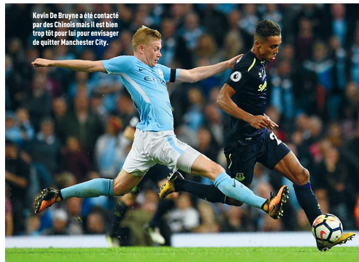
Kevin De Bruyne a été contacté par des Chinois mais il est bien trop tôt pour lui pour envisager de quitter Manchester City.